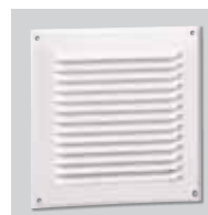
GRA-70 Griglia esterna.