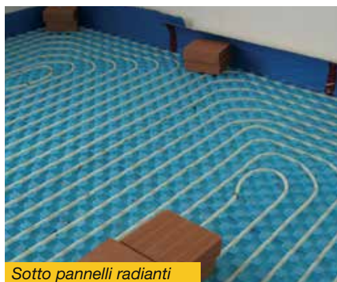
Sotto pannelli radianti